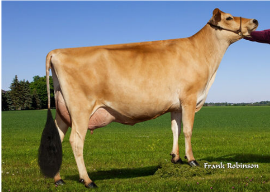
PROGENESIS MADISON- DAM